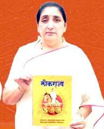
मुनेत्रा अजित पवार उपमुख्यमंत्री