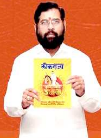
एकनाथ शिंदे उपमुख्यमंत्री