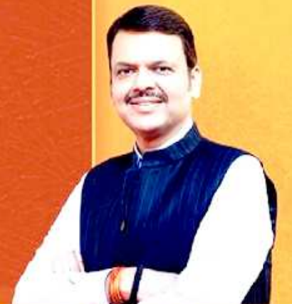
देवेंद्र फडणवीस मुख्यमंत्री